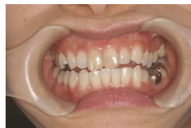
例: オフィスホワイトニング2回施行